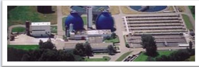
Purification plant for waste water in Mariatal