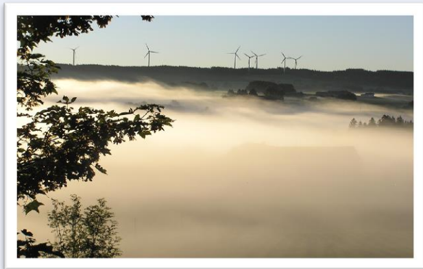
wind park Wildpoldsried