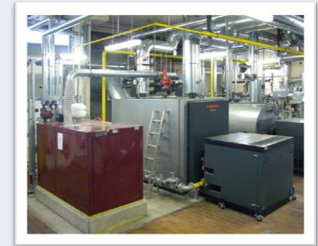
Central district heating